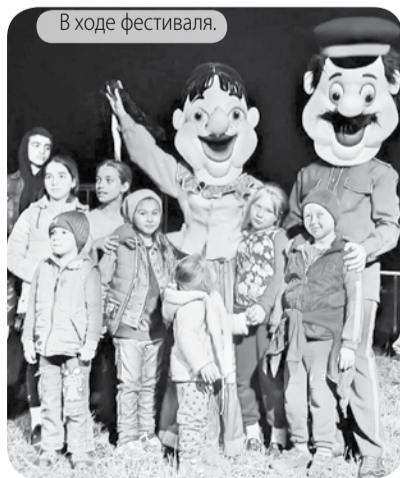
В ходе фестиваля.

В рамках фестиваля «Музыкальная осень Ставрополья» в посёлке имени Чкалова сотрудниками многофункционального передвижного культурного центра «Автоклуб» «ЦДТ» Предгорья была организована музыкальная гостиная «Ставрополье - край казачий».