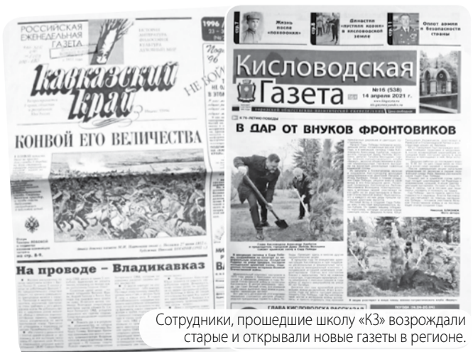
Сотрудники, прошедшие школу «КЗ» возрождали старые и открывали новые газеты в регионе.