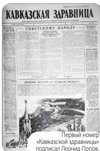
Первый номер «Кавказской здравницы» подписал Леонид Попов.

Главный редактор был номенклатурой крайкома партии, в разное время газету возглавляли: Леонид