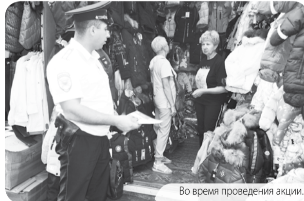
Во время проведения акции.

Особое внимание стражи порядка уделили пожилым гражданам, ведь именно они, как правило, наиболее подвержены обману, чем и пользуются мошенники. Злоумышленники звонят пенсионерам и сообщают, что