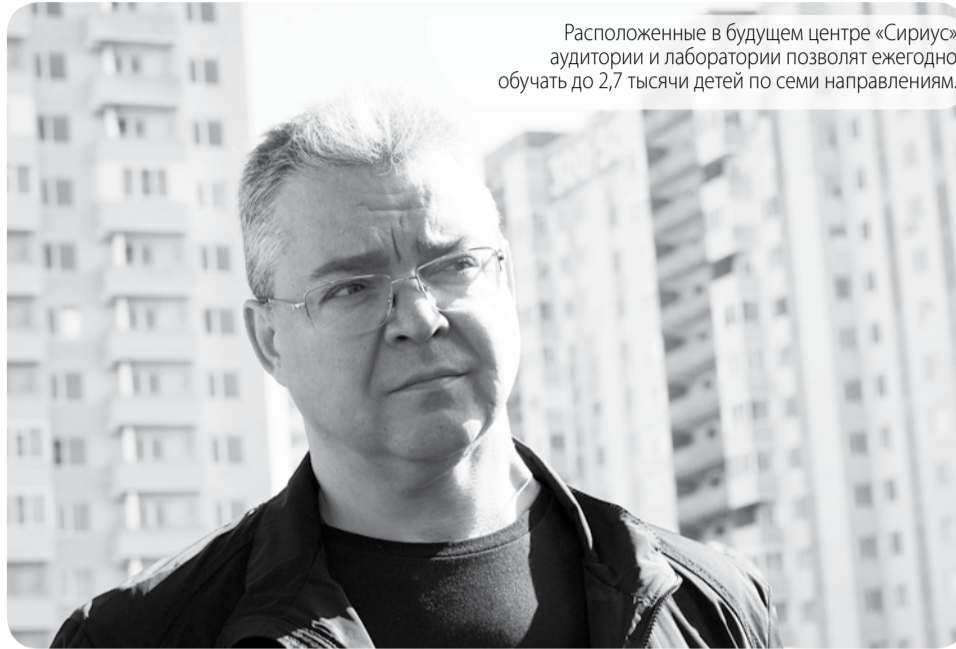
Расположенные в будущем центре «Сириус» аудитории и лаборатории позволят ежегодно обучать до 2,7 тысячи детей по семи направлениям.