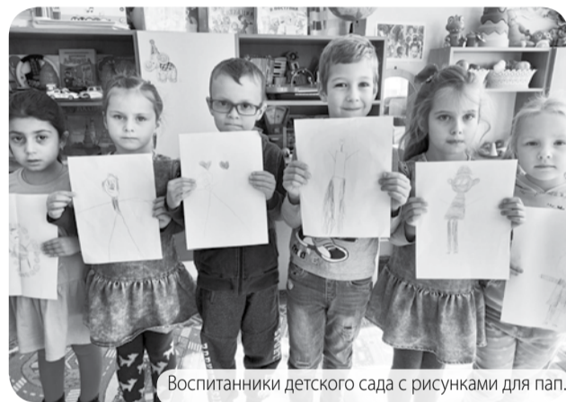
Воспитанники детского сада с рисунками для пап.

В России в третье воскресенье октября отмечается День отца. Название праздника говорит само за себя – это торжество людей, которые ежедневно слышат в свой адрес слово «папа».