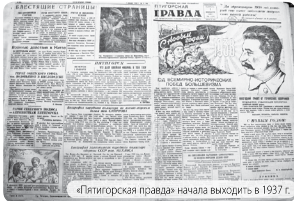
«Пятигорская правда» начала выходить в 1937 г.

«Храня покой страны родимой, Родных заводов, мирных нив, У рубежей земли любимой Щитом надежным мы стоим. Ей нашу жизнь, и кровь, и силы Всегда готовы мы отдать. Бесменно держит вахту мира Армейцев преданная рать. Нам не страшны угрозы вражды, Для них всегда готов ответ. И от бойцов твоих отважных Тебе, Отчизна, наш привет!»