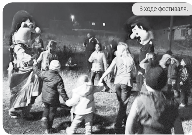
В ходе фестиваля.

Много музыки не бывает, как и не бывает много веселья, но главное, что в этот день удалось создать настоя-