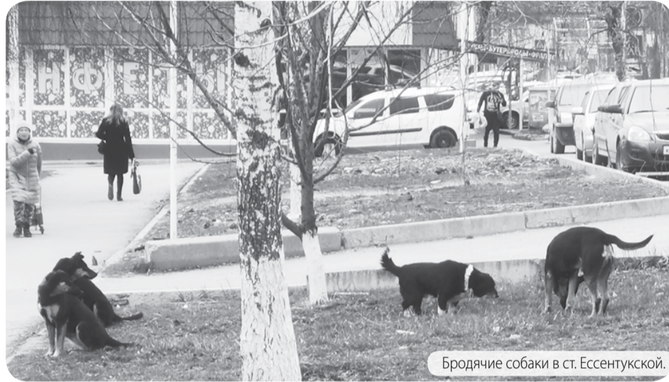
Бродячие собаки в ст. Эссентукской.

Ольга ДЕМЧЕНКО, главный специалист управления сельского хозяйства АПМО.